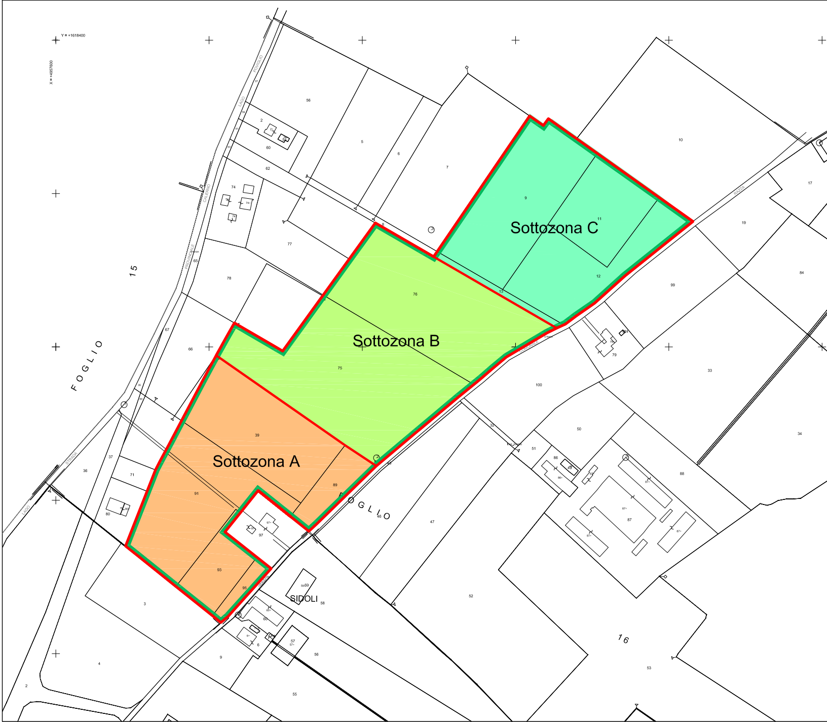
INQUADRAMENTO SU CATASTALE - SCALA 1:5.000